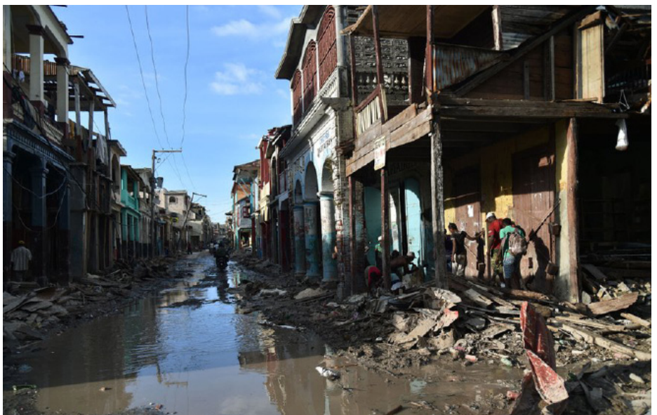
Eine Straße im Westen von Haiti

Am Mittwoch, dem 5. Oktober 2016 hat der Wirbelsturm Matthew in der Karibik getobt. Der heftige Sturm hat viel zerstört, besonders in Haiti ist die Lage schlimm. Hunderte Menschen sind gestorben, tausende haben ihr Zuhause verloren und eine Million Menschen benötigen Hilfe.